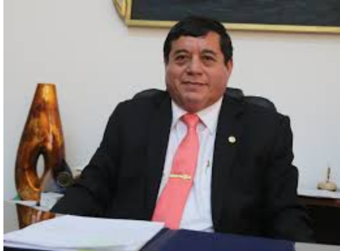
DR. CESAR AUGUSTO REYES PEÑA RECTOR DE LA UNIVERSIDAD NACIONAL DE PIURA

El Rector de la Universidad Nacional de Piura, se complace en dar la bienvenida a todos los alumnos, docentes e investigadores interesados en realizar estudios en nuestra institución.