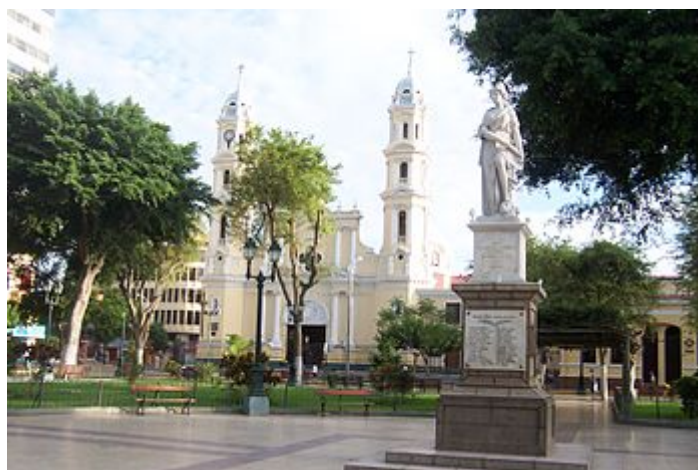
Plaza de Armas de la Ciudad

su Plaza de Armas es una de las más antigua y bellas del país, tiene corte español cuadrado, la plaza tiene una hermosa catedral construida en la época colonial que conserva sus retablos y está rodeada de árboles de tamarindos, ficus, crotos, cucardas, poncianas y papelillos. La ciudad cuenta con varios centros comerciales como Open Plaza, Plaza del Sol, Real Plaza, Plaza de la Luna etc. también cuenta con modernas urbanizaciones, condominios en zonas exclusivas y campos de esparcimiento como restaurantes campestres, campos de futbol, tenis, etc.